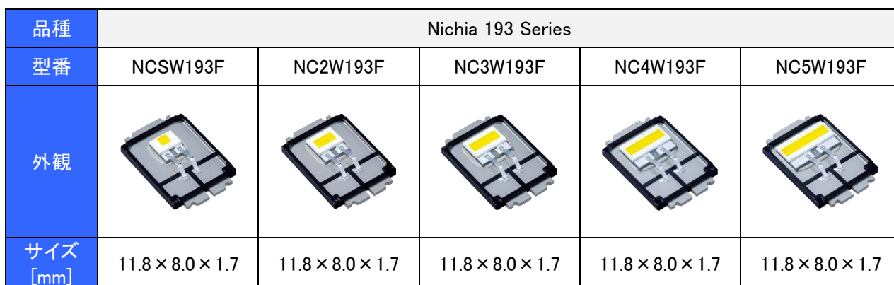
表 1. 適用品種