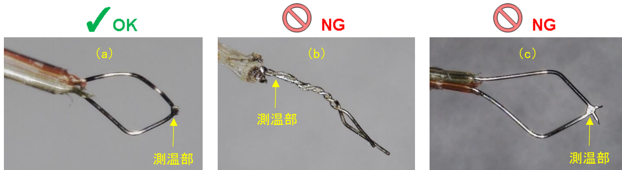
図 3. 熱電対の測温位置

熱電対の測温位置は、接合もしくは接触の根元部分です。図 3(b) のように根元でねじれた熱電対では、先端部分ではなく、ねじれの部分で測温します。熱電対先端が T MP 測定ポイントに接触していても、測温部が離れてしまうと T MP が低くなる可能性があります。測温部が T MP 測定ポイントに接触するようご注意ください。