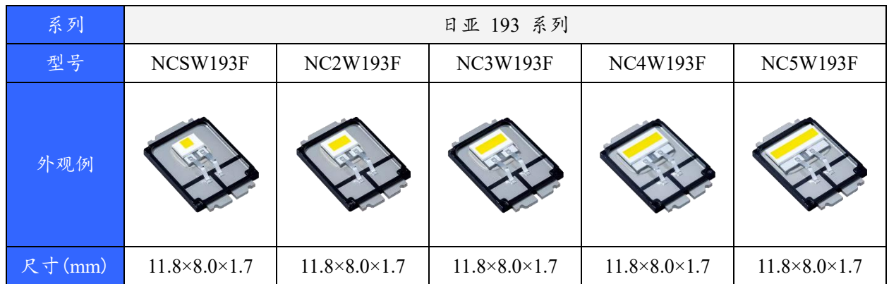
表 1. 适用产品