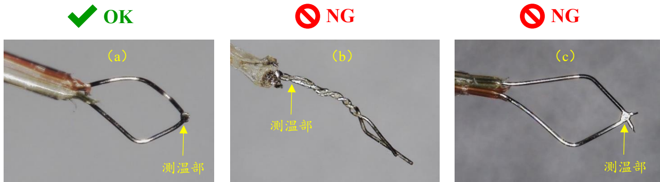
图 3 热电偶的测温位置

热电偶通常是使用热电偶丝的接合处测量。而对于将热电偶丝绞合的如图 3 的 b 的热电偶，测温部不在热电偶丝的前端而是在根部的绞合处，这时即使热电偶丝的前端接触到 T MP 测量点，因为测温部和 T MP 测量点间有距离，所以 T MP 的测量值会比实际值低。因此在热电偶测量时，必须让测温部和 T MP 测量点相接触。