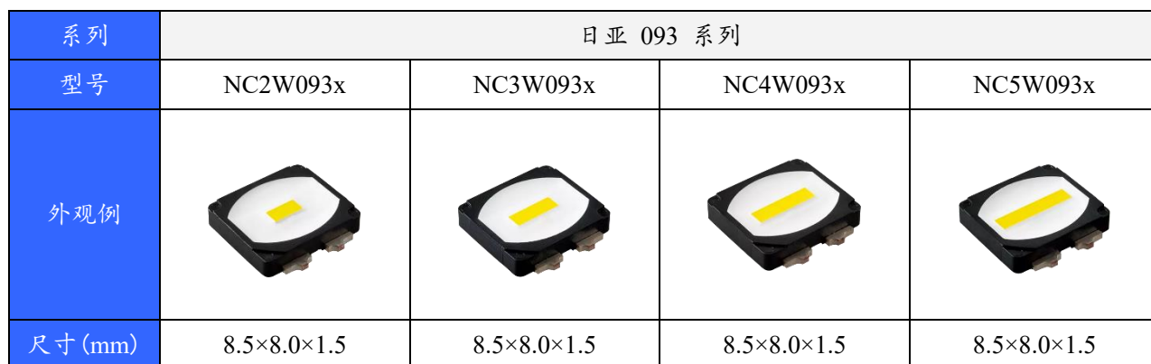
表 1. 适用产品

※：表中的“x”代表同类型 LED。（例如：NC3W093x 代表 NC3W093B、NC3W093B-S1 等）