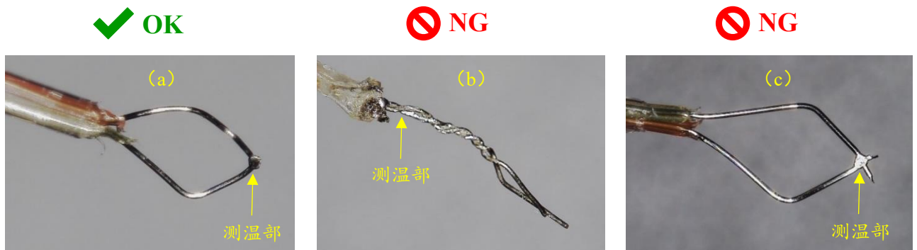
图 3 热电偶的测温位置

热电偶通常是使用热电偶丝的接合处测量。而对于将热电偶丝绞合的如图 3 的 b 的热电偶，测温部不在热电偶丝的前端而是在根部的绞合处，这时即使使热电偶丝的前端接触到 T_{MP} 测量点，因为测温部和 T_{MP} 测量点间有距离，所以 T_{MP} 的测量值会比实际值低。因此在热电偶测量时，必须让测温部和 T_{MP} 测量点相接触。